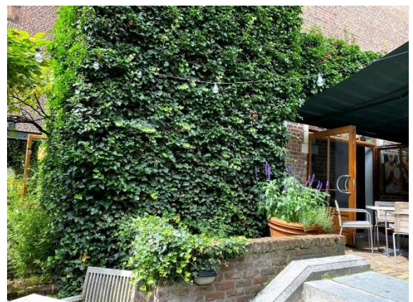
Groengevel met klimop 1

*Om te vermijden dat de klimplant door het gewicht toch van de gevel valt, raden we aan om als beveiliging elke meter een horizontale spankabel van 4 mm te plaatsen op ongeveer 7 cm afstand van de gevel. Deze kabel veranker je in de gevel om de 3 meter.