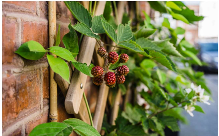
Houten klimhulp met braam