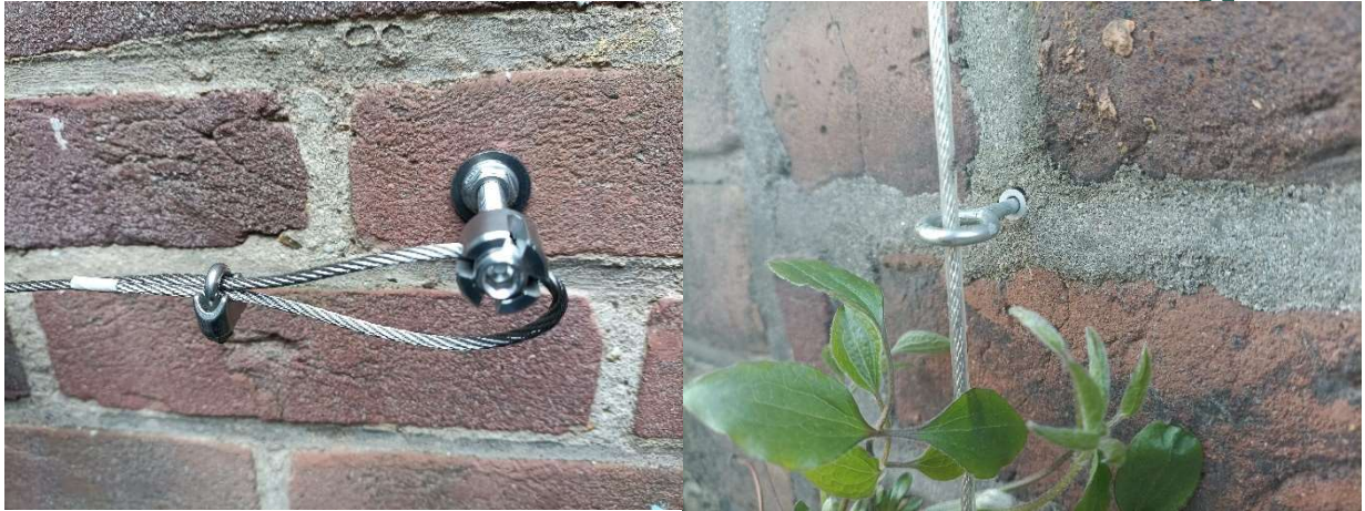
Foto links: Het begin of einde van een spankabel kan je vastzetten met een draadklem. Foto rechts: In plaats van een klemboutschroef kan je ook een oogvijs gebruiken. Indien je voor een rvs kabel kiest, gebruik dan ook rvs bevestigingsmaterialen. Anders kan er versnelde roestvorming optreden door de combinatie van rvs en niet-rvs materialen.